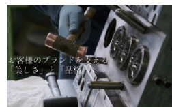
長野吉田工業株式会社